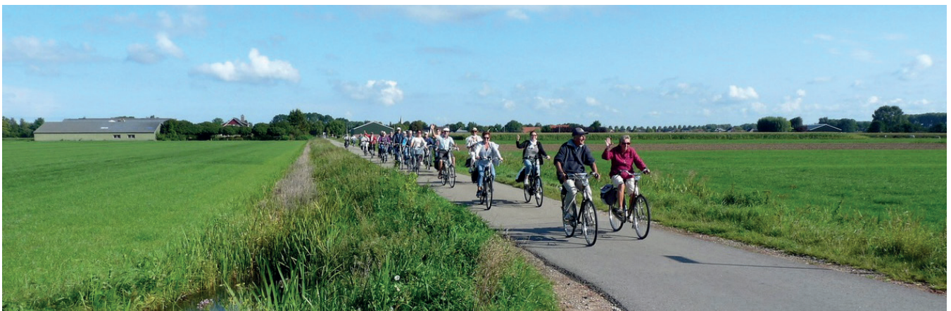
Het bourgondisch fruitwandelen en het bourgondisch fruitfietsen.